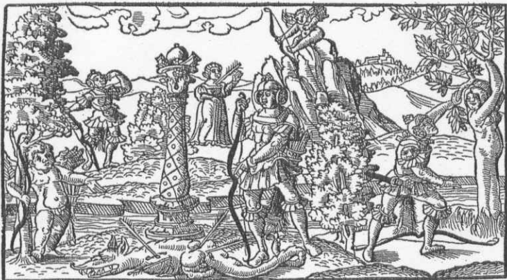
Holzschnittdarstellung zu den Metamorphosen von Ovid

sönliche Erfahrung zurück. Die Schmerzhaftigkeit einer Lebererkrankung könnte ihm bekannt gewesen sein, so dass er, als er eine besonders unangenehme Strafe beschreiben wollte, die Verletzung der Leber wählte. Auch die Mutter des Hektor möchte sich ja an Achilles dadurch rächen, indem sie ihm die Leber verletzt. Auf jeden Fall kann man davon ausgehen, „dass Homer