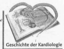
Geschichte der Kardiologie

Blut als auch die gelbe Galle produziert wurden. Nach Hippokrates entstehen durch unterschiedliche Mischung der Säfte bestimmte Konstitutionstypen, auch Temperamente genannt, die zu verschiedenen Krankheiten neigen (wobei auch die Jahreszeit